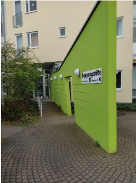
Eingang Vortragsraum gegenüber Straßenbahnhaltestelle

NHV-Vortragsraum im Bürgerzentrum Waldstadt Glogauer Str. 10, 76139 Karlsruhe-Waldstadt